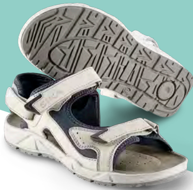
22204 / SIKA MOTION

Leichte, weiche und flexible Sandalen. Mit perfekter Passform , Unterstützung des Fußgewölbes und Komfort