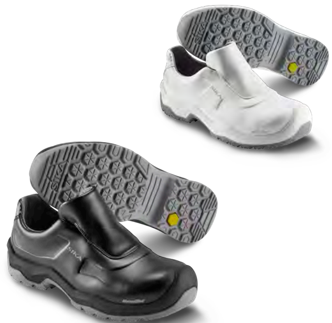
202410 / FIRST

BESONDERE EIGENSCHAFTEN: Mit Gummizug im Ristbereich. Metallfrei