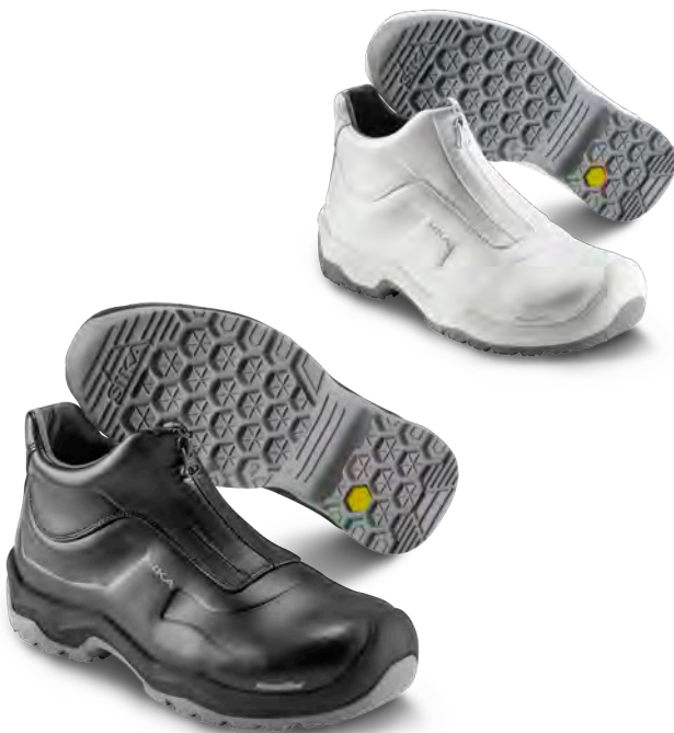
202510 / FRONT

EINLEGESOHLE: Einlegesohle aus atmungsaktivem, schweißtransportierendem und antibakteriellem PU, besonders weichem und druckentlastendem Memory Foam von der Ferse bis zum Vorderfuß