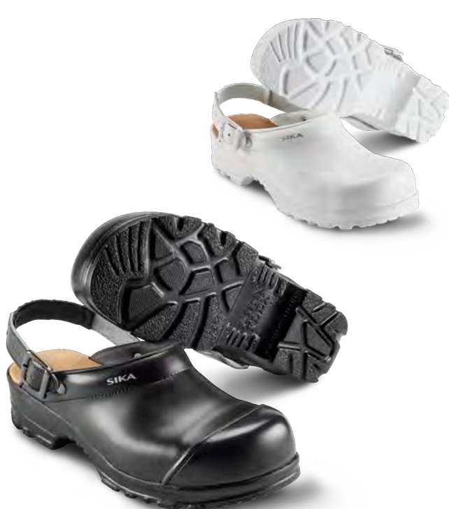
8985 / FLEX LBS