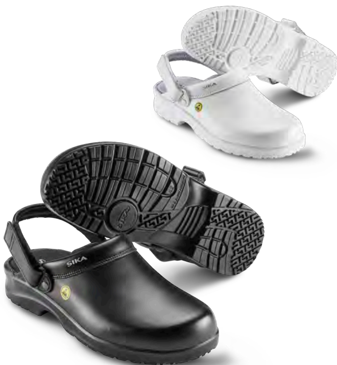
19467 / FUSION CLOG ESD

EINLEGESOHLE: Auswechselbare Einlegesohle aus atmungsaktivem, schweißtransportierendem Material mit antibakterieller Eigenschaft. Waschbar bei 30 °C