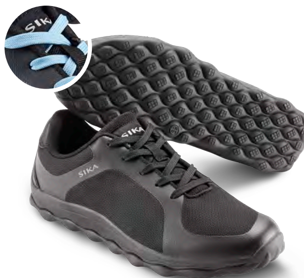
50011 / MOVE