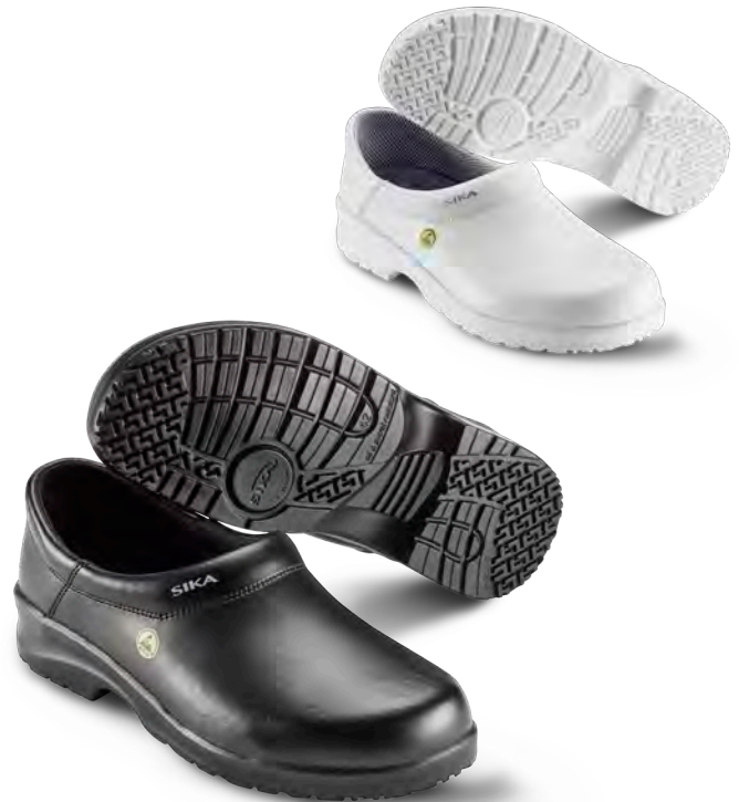
19466 / FUSION CLOG ESD