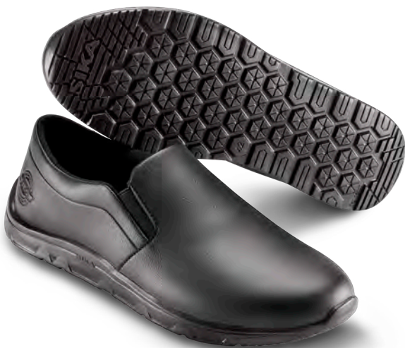
19302 / STABLE

Strapazierfähiger leichter Berufsschuh mit bester Rutschhemmung