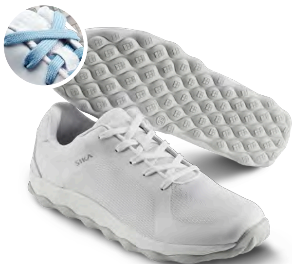
50011 / MOVE