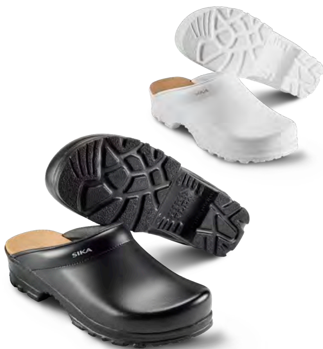
8105 / FLEX LBS