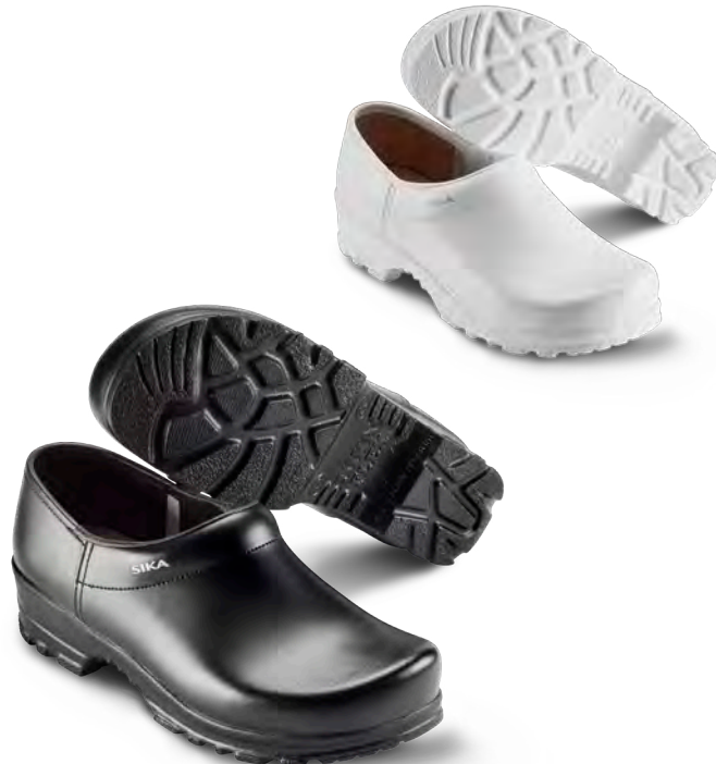
8005 / FLEX LBS