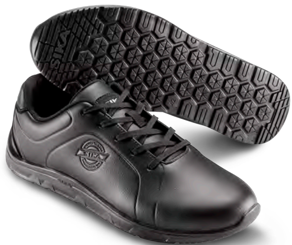
19301 / BALANCE