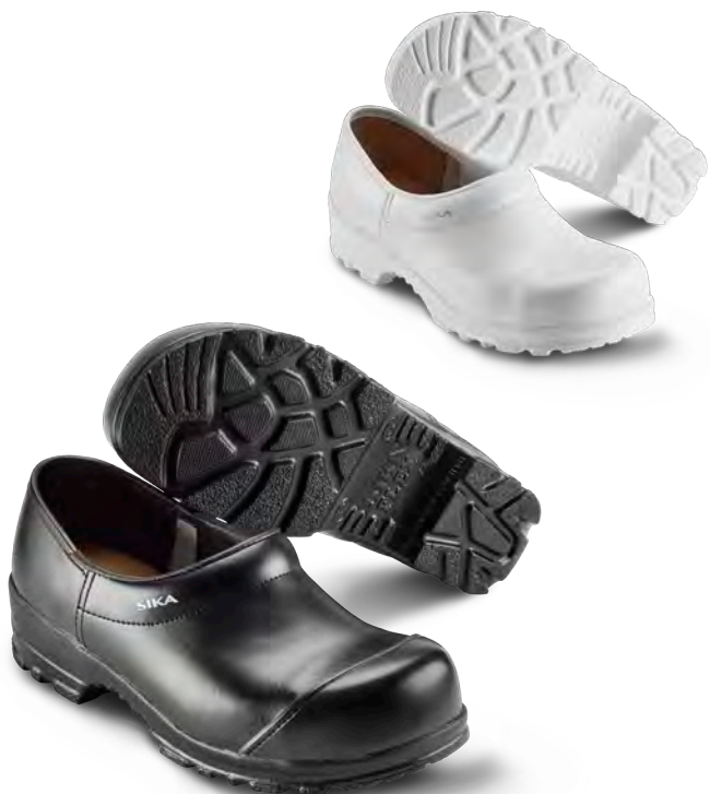
885 / FLEX LBS